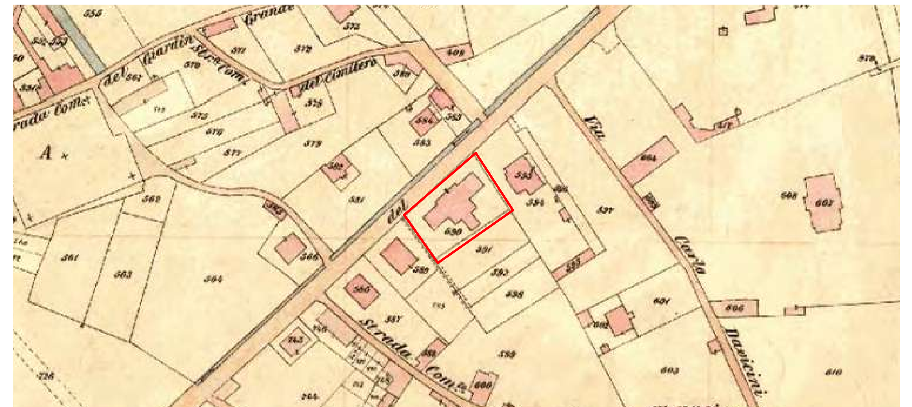
Originali di impianto catastale