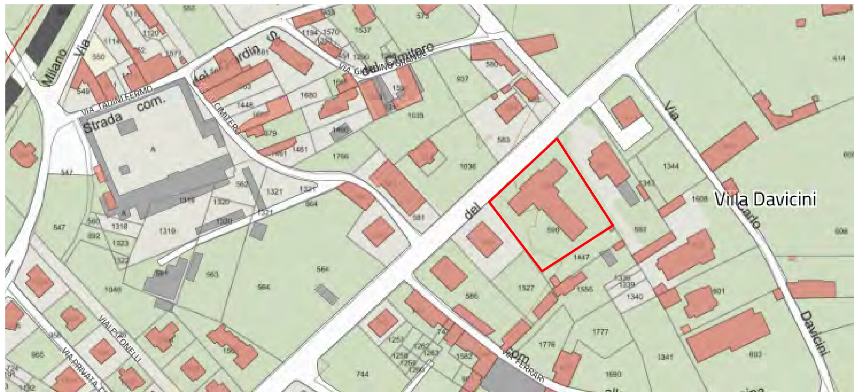
Estratto mappa - Particella 590 - Foglio 17505